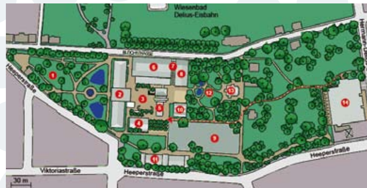
Lage Veranstaltungsort im Ravensberger Park

Bitte abtrennen und ausgefüllt an uns zurückfaxen!